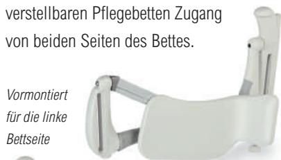
Vormontiert für die linke Bettseite

Das einzigartige Design des Multifit LegLifter kann an verschiedenste Bettenrahmen angepasst werden und bietet sowohl bei normalen Betten wie auch bei verstellbaren Pflegebetten Zugang von beiden Seiten des Bettes.