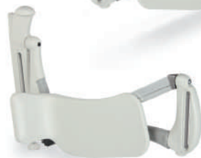
Vormontiert für die rechte Bettseite

Der Multifit LegLifter verfügt über dünne, aber starke Stabilisierungsleisten, die unter die Matratze passen und für eine stabile Konstruktion und einen behutsamen Betrieb sorgen. Er ist zum Einbau in Federkern- Rahmen-, Federholz- und Kastenrahmen geeignet. Einige verstellbare Pflegebetten benötigen möglicherweise speziell ausgelegte Stabilisierungsleisten, die zur Art und Breite des Rahmens passen. Bitte geben Sie uns bei Anfragen oder Bestellungen folgende Informationen: